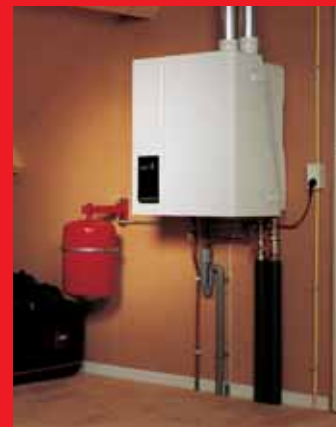
EcomLine Classic HR 22 of 30.