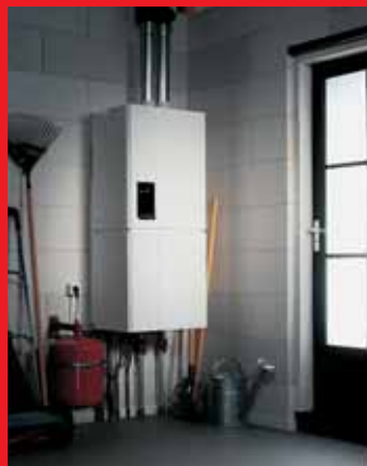
EcomLine Classic HR Combi 22 of 30 met ingebouwde 25 liter boiler (verticale uitvoering).

Beide boilers kunnen ook worden gecombineerd met de EcomLine Classic HR 43.