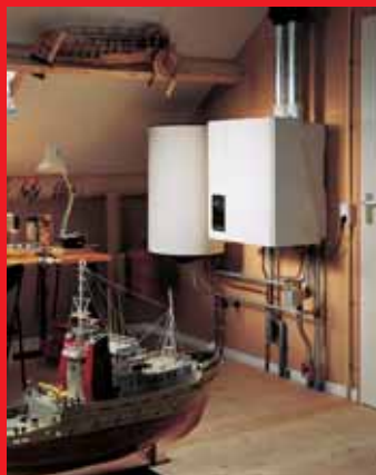
EcomLine Classic HR 22 of 30 met 80 liter boiler. Er is ook een 120 liter boiler.

Beide boilers kunnen ook worden gecombineerd met de EcomLine Classic HR 43.