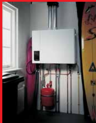
EcomLine Classic HR Combi 22 of 30 met ingebouwde 25 liter boiler (horizontale uitvoering). Een EcomLine Classic HR 43 of 65 (zonder boiler) ziet er hetzelfde uit.